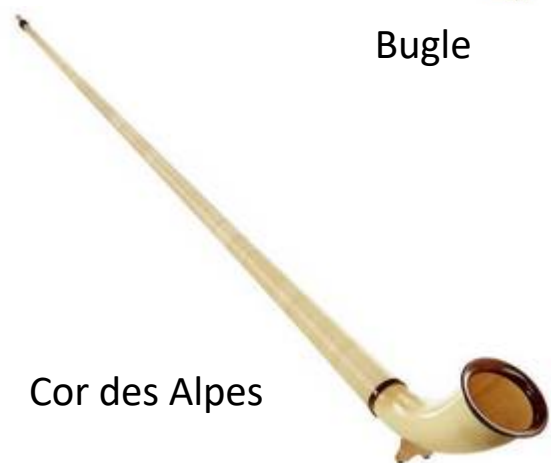
Cor des Alpes