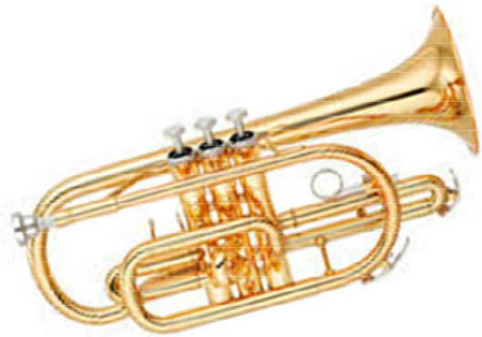
Cornet à pistons