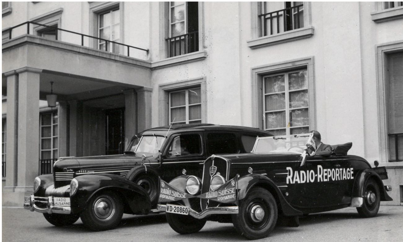
Les premiers véhicules de reportage