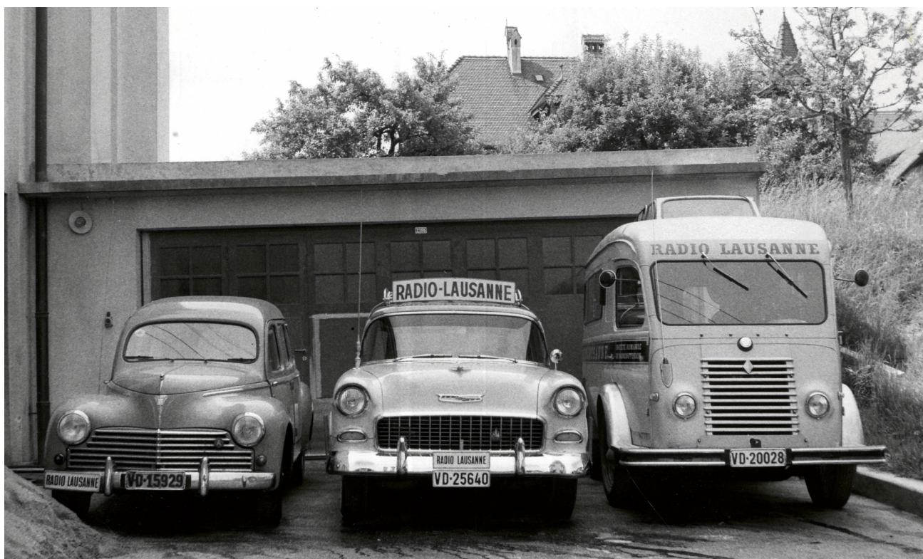
Les véhicules de reportage des années 1950 – photo archives de la RTS