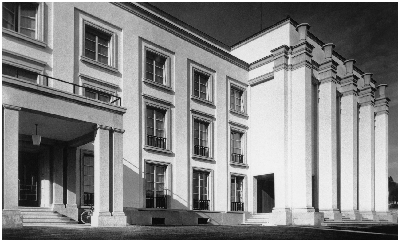
Radio Lausanne 1935