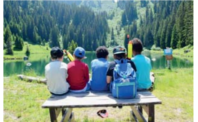
Le camp d'automne se déroulera lors de la première semaine des vacances scolaires d'automne.

Du lundi 3 au vendredi 7 octobre 2022, le Service de la jeunesse de la Ville de La Chaux-de-Fonds organise son traditionnel camp d'automne, qui plonge cette année les participants dans les mystères celtiques avec comme thème «à la découverte du menhir de Bevaix».