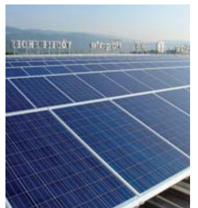
Le Groupe E a misé sur les emprunts obligataires. SP-GROUPE E

L'entreprise ne produit en effet qu'une partie de ce qu'elle livre à ses clients, le reste étant acheté sur les marchés. ATS